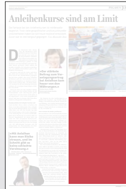
1/4 Seite 134 x 200 mm

Preis € 2.904,- Vorteilspreis € 2.032,80