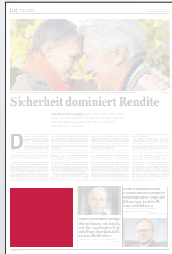
Steckbrief 2-spaltig 106,4 x 100 mm

Preis € 2.766,- Vorteilspreis € 1.936,20