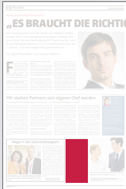
Steckbrief 1-spaltig 51,2 x 100 mm