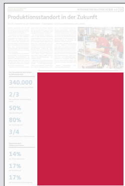
Juniorpage 202 x 265 mm

Preis € 13.830,- Vorteilspreis € 9.681,-