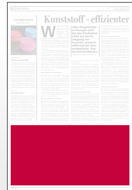
1/3 Seite 272 x 135 mm

Preis € 6.345,- Vorteilspreis € 4.441,50