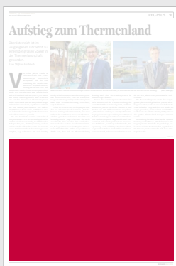
1/2 Seite 272 x 200 mm

Preis € 8.565,75 Vorteilspreis € 5.996,02