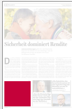
Steckbrief 2-spaltig 106,4 x 100 mm

Preis € 2.538,- Vorteilspreis € 1.776,60