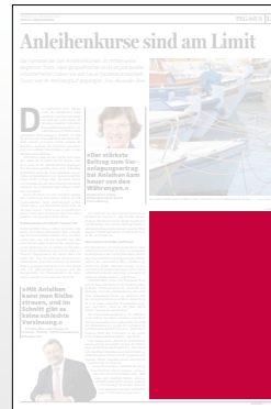
1/4 Seite 134 x 200 mm

Preis € 2.538,- Vorteilspreis € 1.776,60