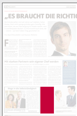
Steckbrief 1-spaltig 51,2 x 100 mm