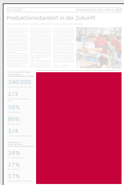
Juniorpage 202 x 265 mm

Preis € 12.690,- Vorteilspreis € 8.883,-