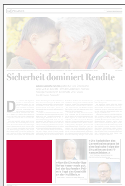
Steckbrief 2-spaltig 106,4 x 100 mm

Preis € 2.538,- Vorteilspreis € 1.776,60