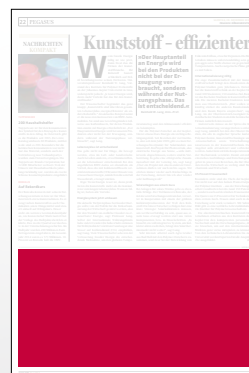
1/3 Seite 272 x 135 mm

Preis € 6.345,- Vorteilspreis € 4.441,50