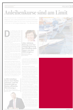
1/4 Seite 134 x 200 mm

Preis € 2.538,- Vorteilspreis € 1.776,60